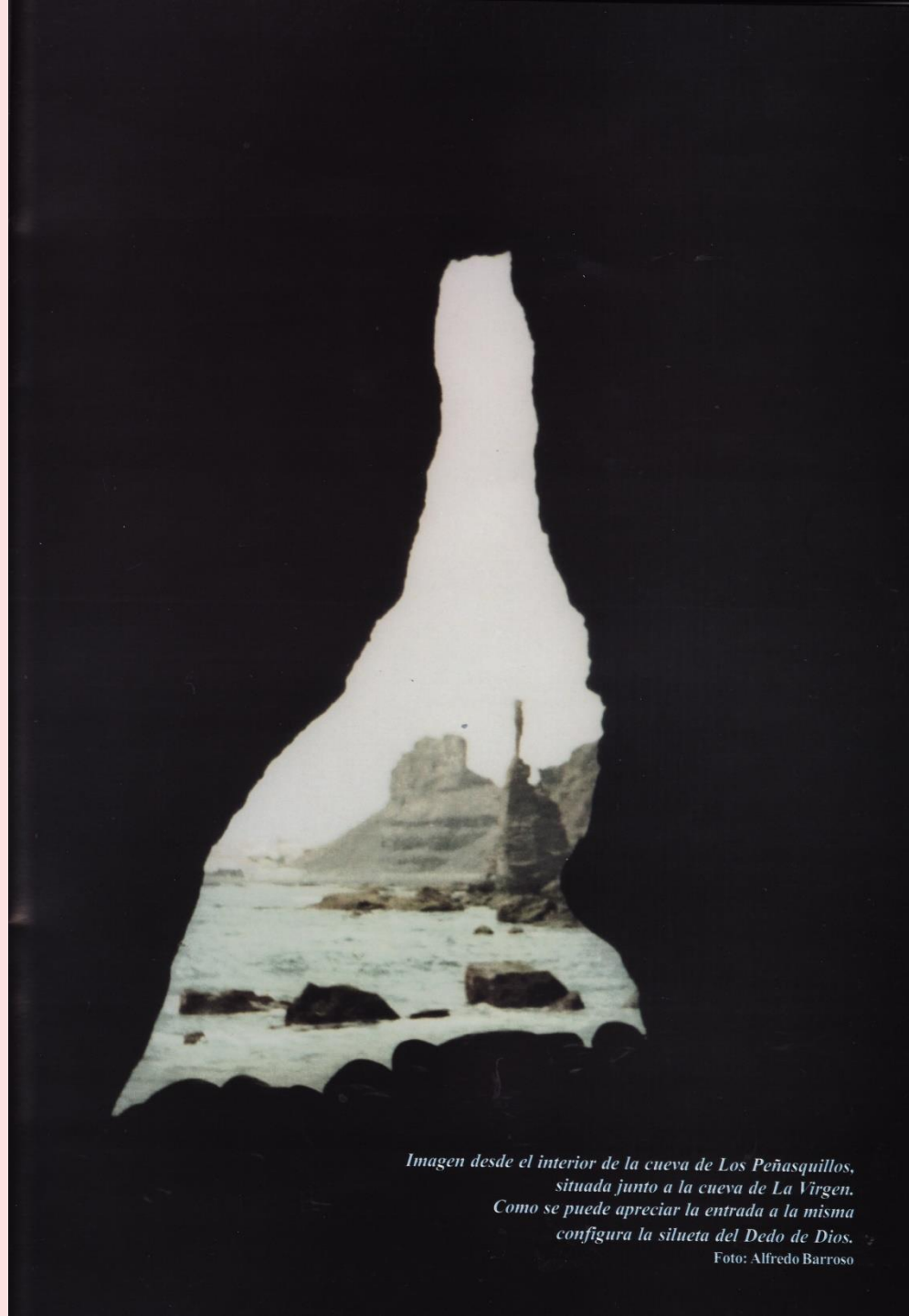
Imagen desde el interior de la cueva de Los Peñasquillos, situada junto a la cueva de La Virgen. Como se puede apreciar la entrada a la misma configura la silueta del Dedo de Dios.