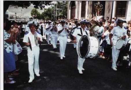
Banda de Agaete.