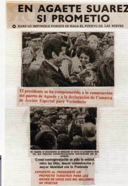
Autoridades paseando por la calle Concepción durante las VI Jornadas Culturales del Archipiélago del año 1976.