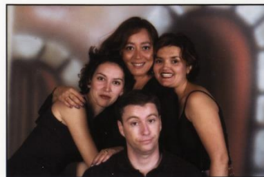
"Contigo aprendi" no es más que la venganza de tres mujeres frustradas contra el hombre que las ha engañado y, en el fondo, un alegato contra el machismo.