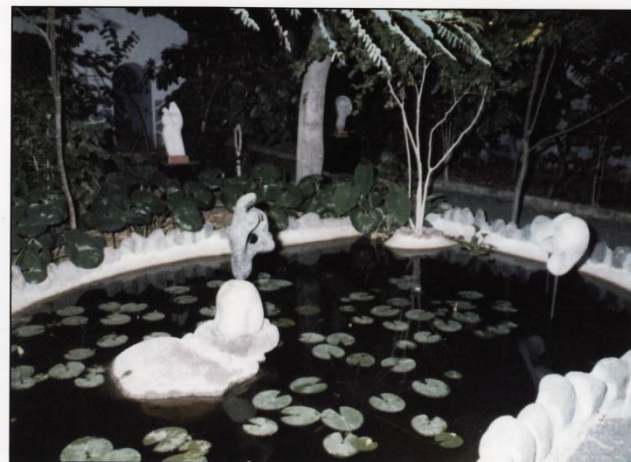
Fuente del Huerto de Las Flores durante las VI Jornadas Culturales del Archipiélago del año 1976.