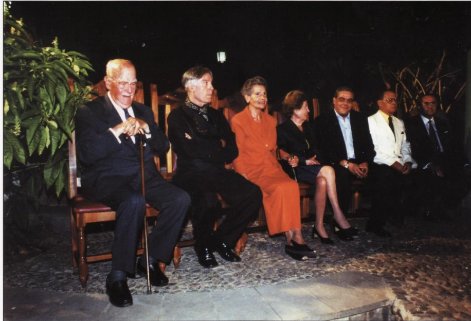
Entrega de honores y distinciones Fiestas de Las Nieves 2001.

Por la trayectoria llevada durante su vida, tanto profesional como humana