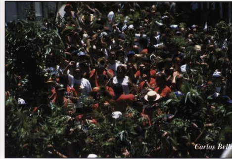
Banda de Guayedra en la Rama 2000