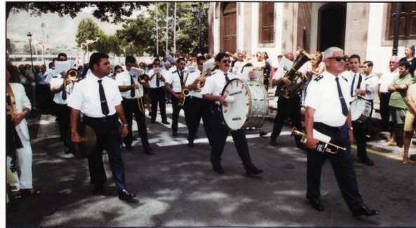
Agrupación Musical Guayedra