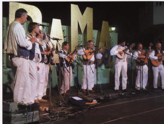
La Parranda Cuasquia en el XV Encuentro de la Canción Marinera.