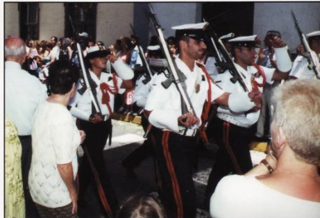
Escuadra de Gastadores de la Banda de Infantería de Marina.