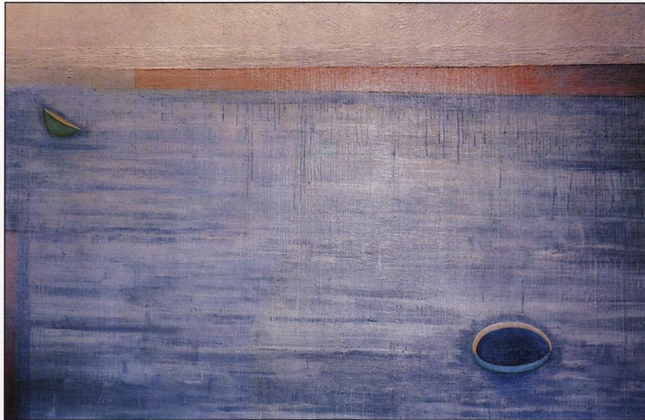
La Boca (1988) - Acrílico sobre lienzo 200 x 300 cm. Colección privada. Gran Canaria

Nacido en Santa Cruz de Tenerife en 1933 Manuel Padorno es uno de los renombrados poetas canarios de su generación. Entre 1942 y 1944 su familia se traslada a Barcelona. De regreso a las islas y tras completar la educación secundaria Padorno comienza su vida profesional a los veinte años que alterna con continuos estudios sobre poesía europea. No recibe formación académica artística. Su relación con el arte es espontánea y autodidacta y no está estrictamente supeditada a la mera ilustración de un imaginario poético que reviste una fundamental dimensión visual; más bien su carrera artística ilustra otros aspectos de su pensamiento relacionados con la estética.