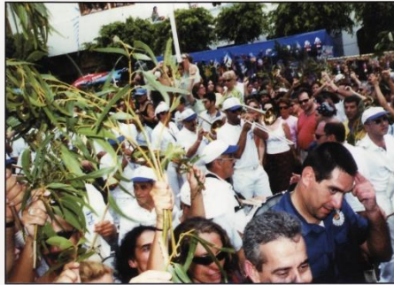
Banda de Agaete en la Rama 2001