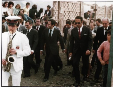
Visita del que fuera Presidente del Gobierno de España don Adolfo Suárez y una reseña periodística de dicho evento.