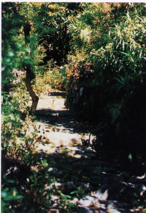
VENANCIO LUGO GONZÁLEZ

Y la húmeda profundidad del Valle, que a través de sus horizontes imprecisos deja adivinar vastas junglas de helechos arborescentes, florestas tamizadas por el vapor de las horas del día y de la noche.