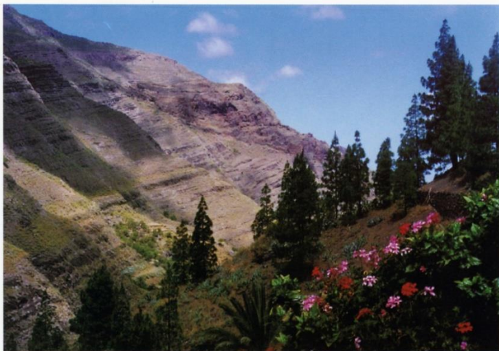
JERÓNIMO SUÁREZ SUÁREZ.

Enamorada de sus costumbres, celosa de sus ritos, conserva los jardines, los lugares sagrados a la orilla del mar y de los bosques rumorosos, los valles y barrancos, las altas palmeras cuyas hojas tocan el arpa con el viento y las sendas que serpentean entre los montes para internarse en las tierras santas donde danzan a la noche los habitantes del agua o cantan invisibles a la luz del sol.