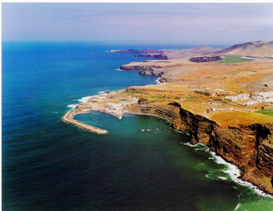
Portada: MIRÓ MAINOU Cartel anunciador de las Fiestas de Las Nieves. Villa de Agaete