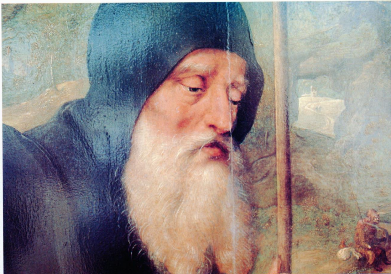
Detalle Tríptico Nuestra Sra. de las Nieves. Siglo XVI.