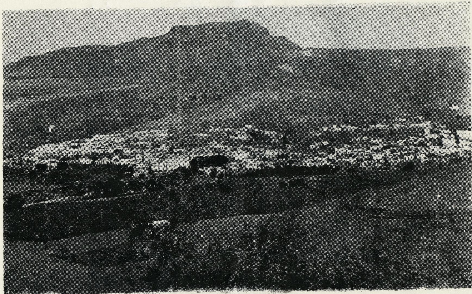
VISTA GENERAL DE LA VILLA DE AGAETE