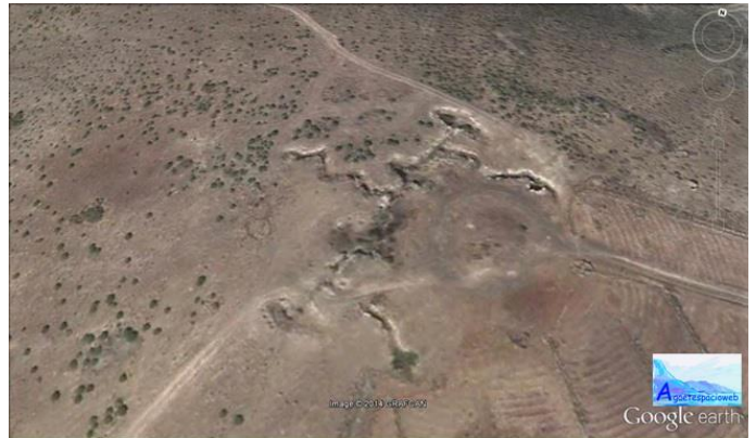
TRINCHERA DE LA II GUERRA MUNDIAL Localizada en la Montaña de las Moriscas

por la precariedad de medios de la época y la centralización de los disponibles en la zona de Las Palmas - Gando.